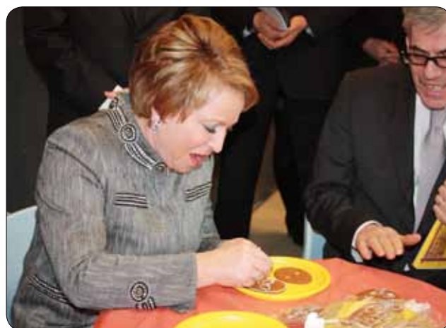
Губернатор Санкт-Петербурга В. И. Матвиенко на «итальянском» мастер класса