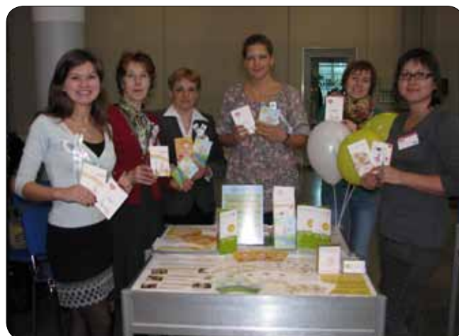
Волонтеры центра на книжной ярмарке в Ленэкспо