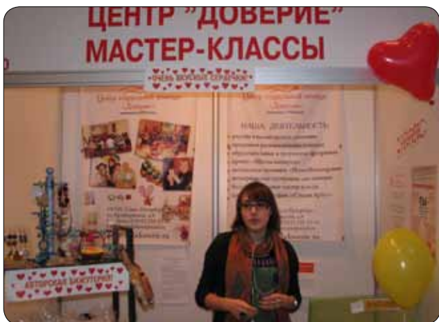
На фестивале «Мосты любви»